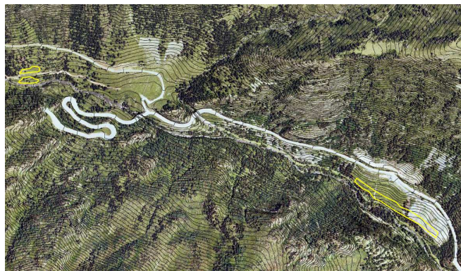
Corb - Castellar